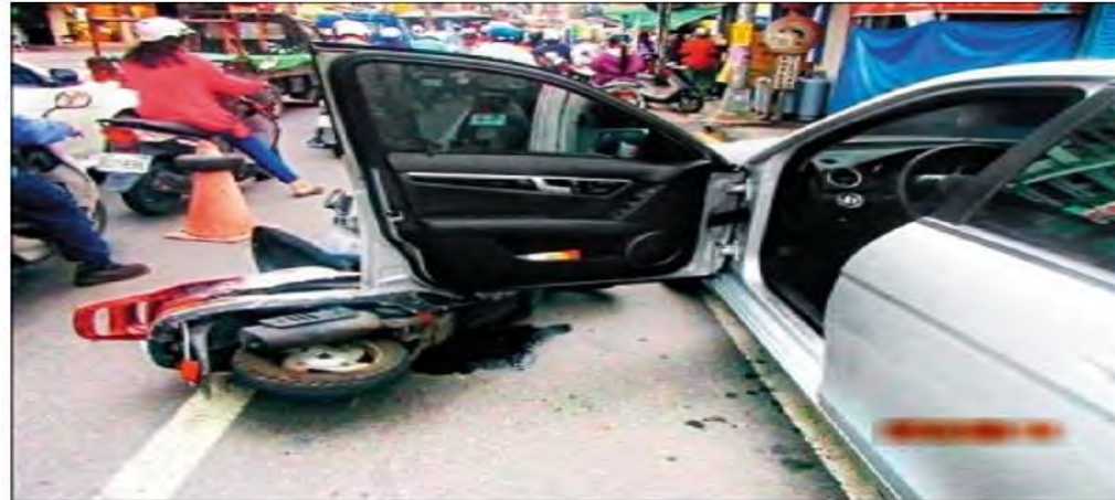
車禍示意圖，與本新聞無關。